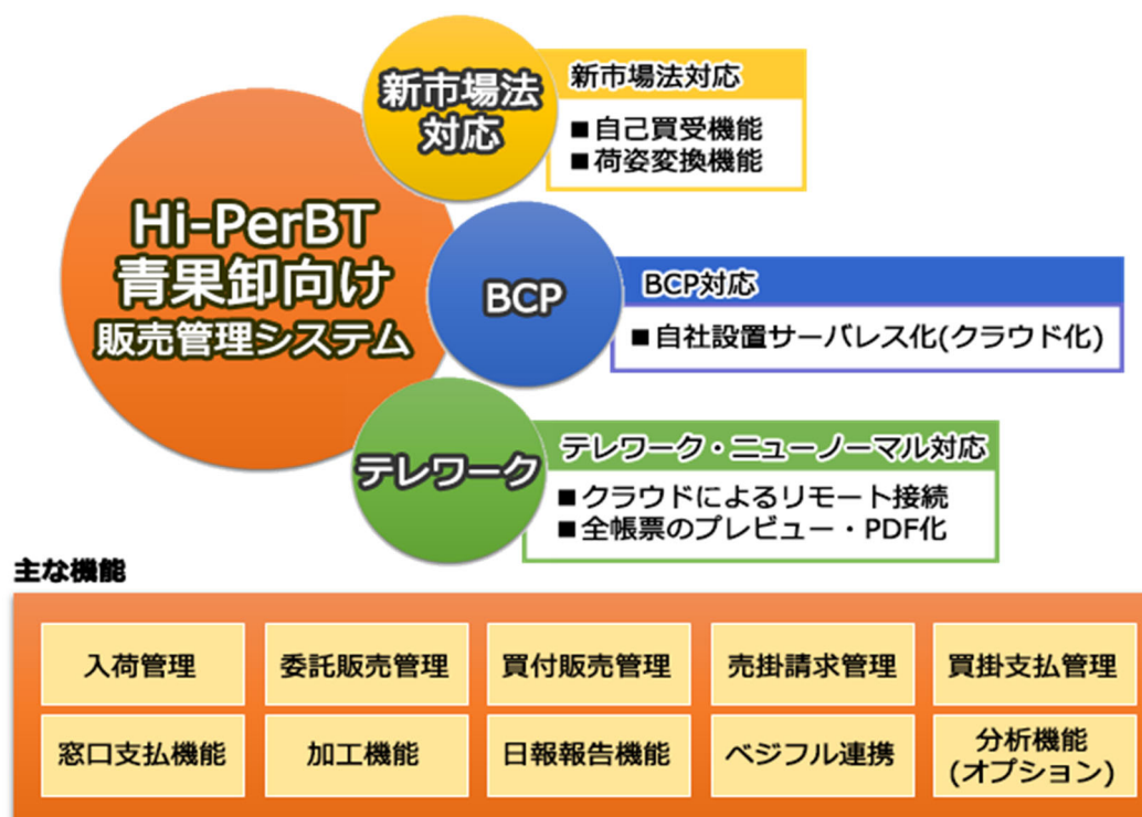
図2. Hi-PerBT 青果卸向け販売管理システムの主な機能

また、昨今の新型コロナウイルスの感染拡大により、リモートワーク環境を整備することが必要となっています。「Hi-PerBT 青果卸向け販売管理システム」は、クラウドサービスでの提供のため、インターネット環境があれば自宅などからも利用できますので、新たにインフラを整備することなくニューノーマルな働き方に対応できます。